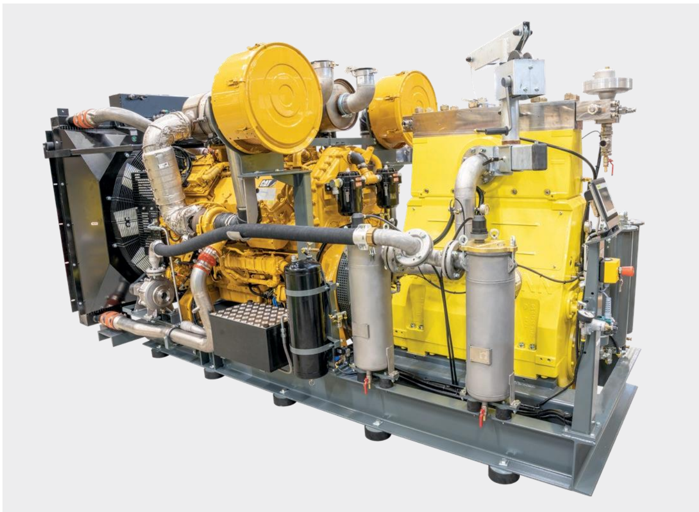
Стационарная установка с дизельным двигателем